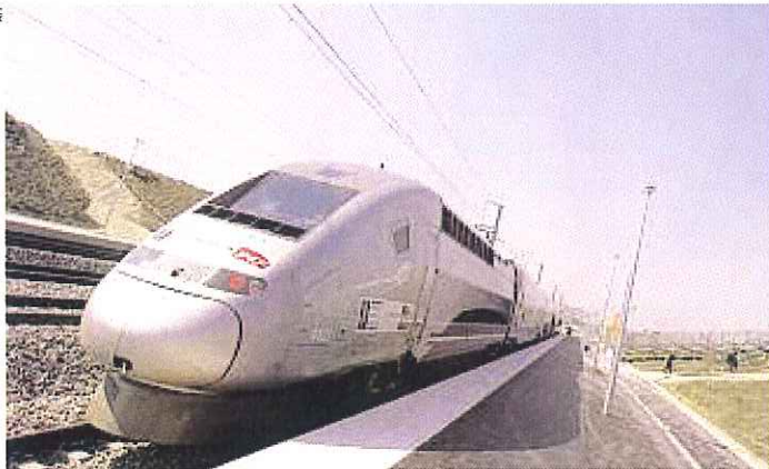
Le TGV français devrait pulvériser mardi son propre record mondial de vitesse sur rails, en tentant d'atteindre une vitesse d'au moins 560 km/h.

Il faut dire que Reims ne sera plus qu'à 45 minutes de Paris, avec des prix qui ne dépassent pas les 3 500 euros le mètre carré. Une aubaine pour nombre de famille qui pourraient se laisser tenter par un achat dans l'Est de la France, et continuer à venir travailler dans la capitale. Car c'est l'autre effet TGV : l'apparition des "navetteurs", ces gens qui prennent le TGV pour aller travailler, comme d'autres prennent leur voiture. Ainsi, ils sont désor-